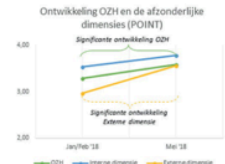
Figuur 3 De ontwikkeling van de OZH van het POINT-netwerk met hierbij significante ontwikkelmomenten aangegeven